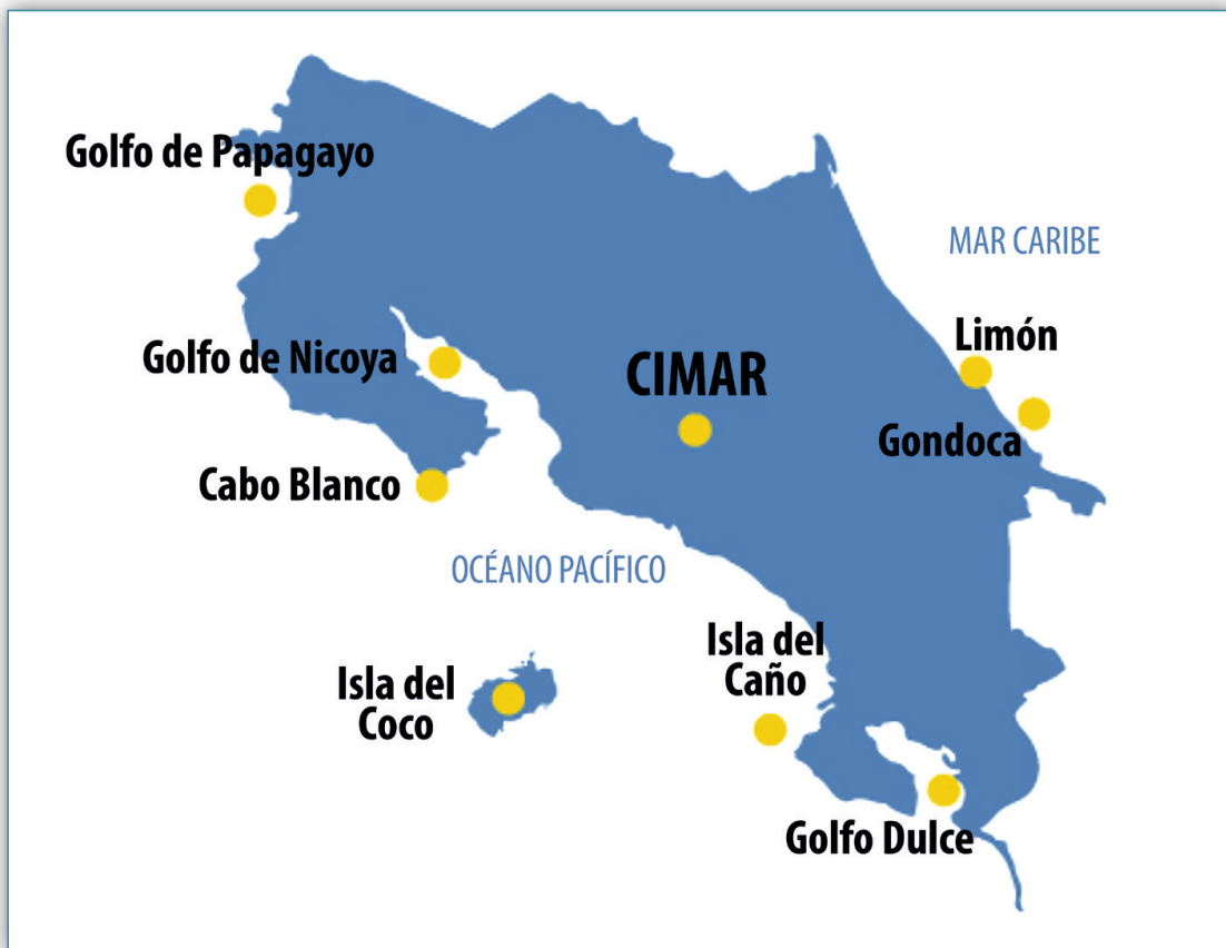
Figura 17. Sitios de investigación del CIMAR