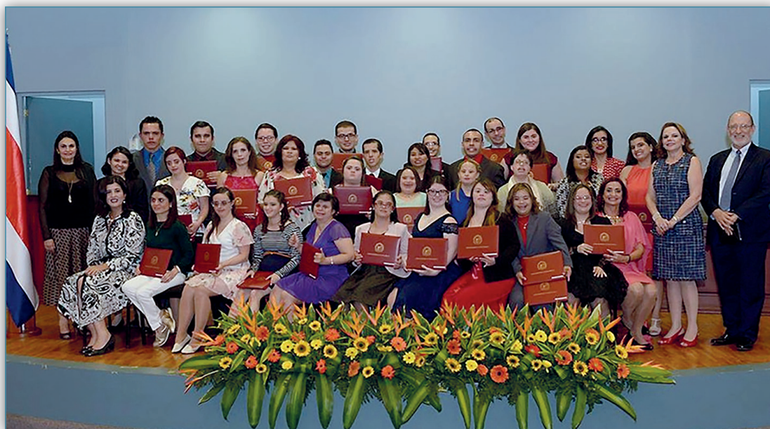
Figura 10. Graduación PROCALA

En el año 2015 inició el Proyecto de Cursos Libres de Capacitación Laboral (PROCALA), que consiste en una oferta de cursos para capacitación laboral dirigido a estudiantes de PROIN, en colaboración con el Consejo de la Política de la Persona Joven del Ministerio de Cultura y Juventud (MCJ). Este Programa ya graduó los primeros 31 estudiantes en el año 2017. Los estudiantes recibieron un certificado de aprovechamiento (avalado por Servicio Civil), lo cual les permitirá un mejor ingreso al mercado laboral con base en su preparación Universitaria.