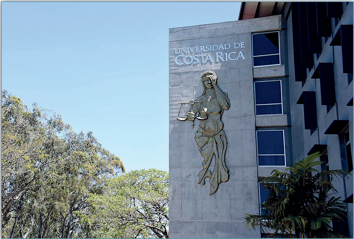
Figura 2. Facultad de Derecho, 2018