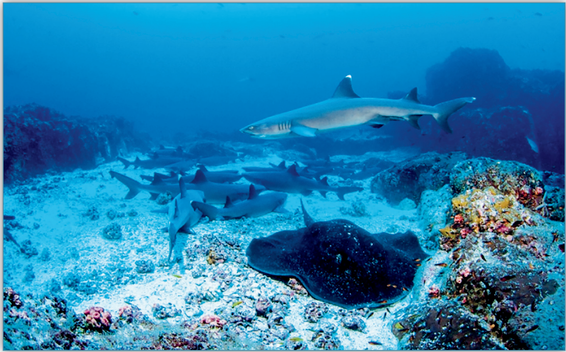
Figura 18. Estudios del CIMAR