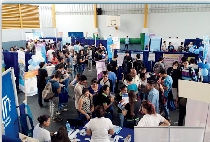
Figura 8. Feria vocacional

Para que el estudiante de secundaria se oriente en la escogencia de la carrera universitaria, la UCR ha realizado la Feria Vocacional durante más de 20 años con una participación cercana a 20 000 jóvenes por año, que visitan la institución para conocer las diferentes ofertas de carreras.