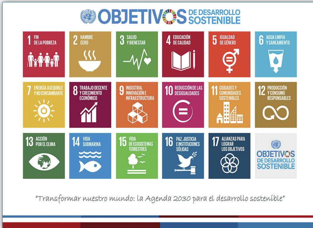
Figura 3. Objetivos de Desarrollo Sostenible para la Agenda de Desarrollo 2030

Costa Rica fue uno de los 193 países firmantes de la Declaración de los Objetivos de Desarrollo Sostenible de la Agenda 2030. El compromiso de los firmantes de esta declaración es realizar un conjunto de programas, acciones y directrices que orienten el trabajo en conjunto con las Naciones Unidas camino al desarrollo sostenible.