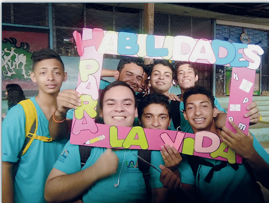
Figura 9. Proyecto habilidades por la vida

integradas con el proceso de orientación para la vida, con la población de décimo y undécimo año. Este proyecto se ha desarrollado con estudiantes de colegios que se ubican en las zonas de Sarapiquí y Nicoya.