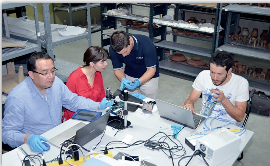
Figura 15. Expertos de la Universidad de Costa Rica (UCR) formaron una red junto con otras instituciones nacionales e internacionales con el objetivo de restaurar y conservar el patrimonio nacional costarricense