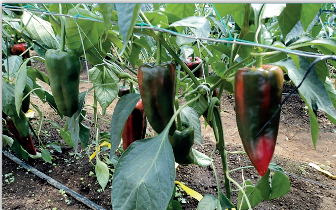
Figura 5. La variedad de chile dulce “Dulcítico” al ser mejorada en condiciones de Costa Rica, está mejor adaptada a las condiciones agroclimáticas por lo que es más productiva