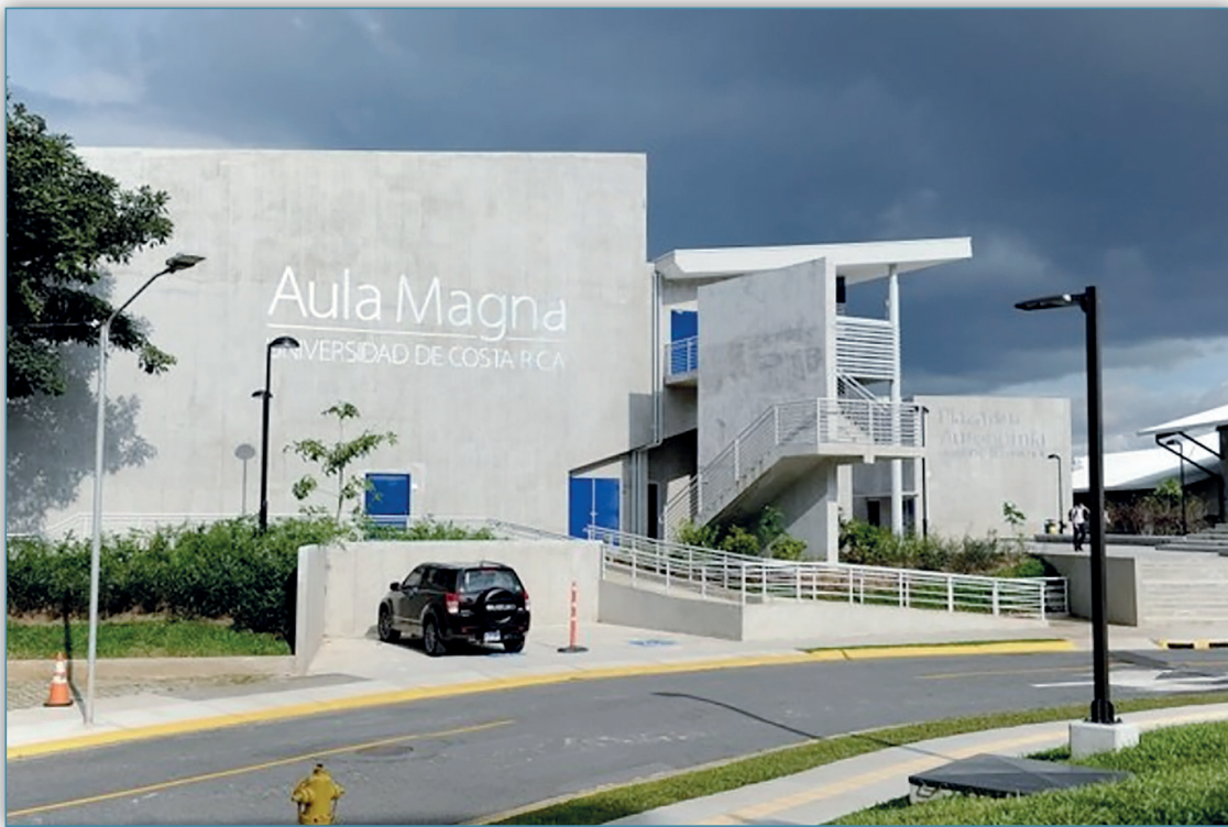
Figura 1. Oficina de Divulgación, 2018, Plaza de la Autonomía