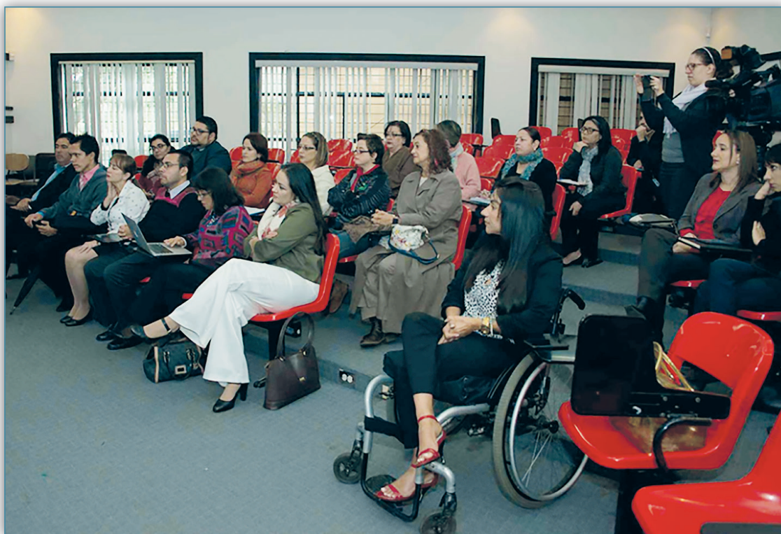
Figura 4. Oficina de Divulgación, 2017. Presentación del modelo de empleabilidad que utiliza la universidad

La Institución reserva tres plazas de tiempo completo para esta población sea académica o administrativa.