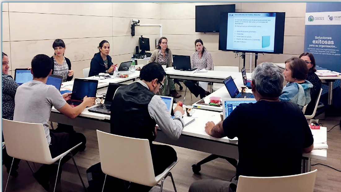
Figura 13. Programa Modular en evaluación