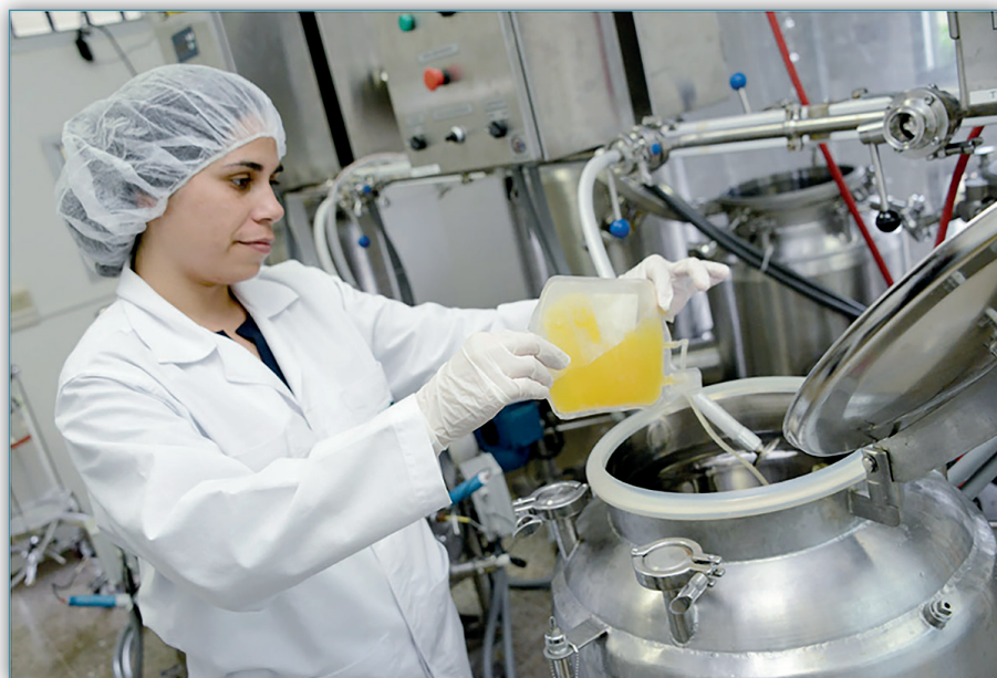
Figura 6. Fraccionamiento de plasma. Instituto Clodomiro Picado