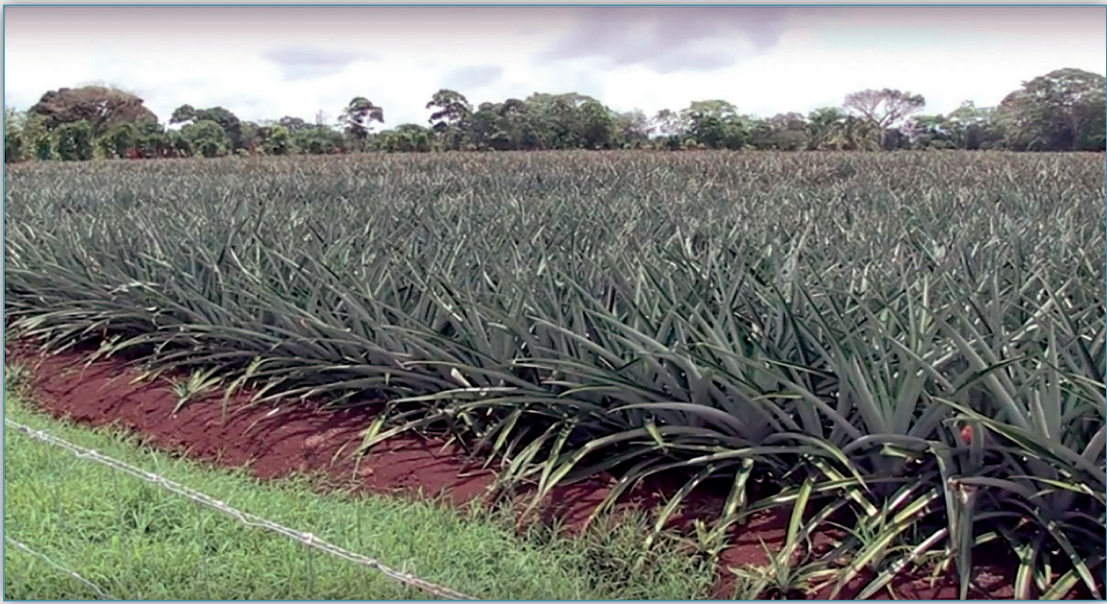
Figura 16. Los investigadores (as) de la UCR atribuyen la contaminación de las aguas a algunos de los agroquímicos que se utilizan en la producción de piña en la Zona Norte de Costa Rica