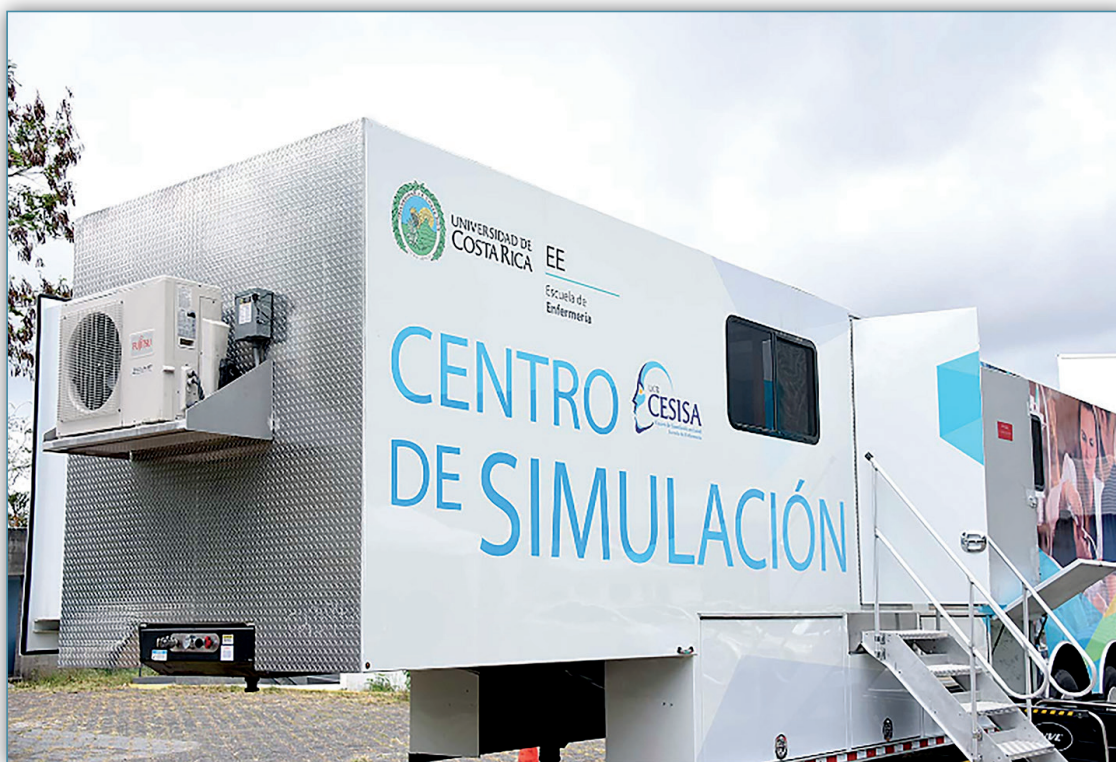
Figura 7. Centro de Simulación clínica móvil. Escuela de Enfermería