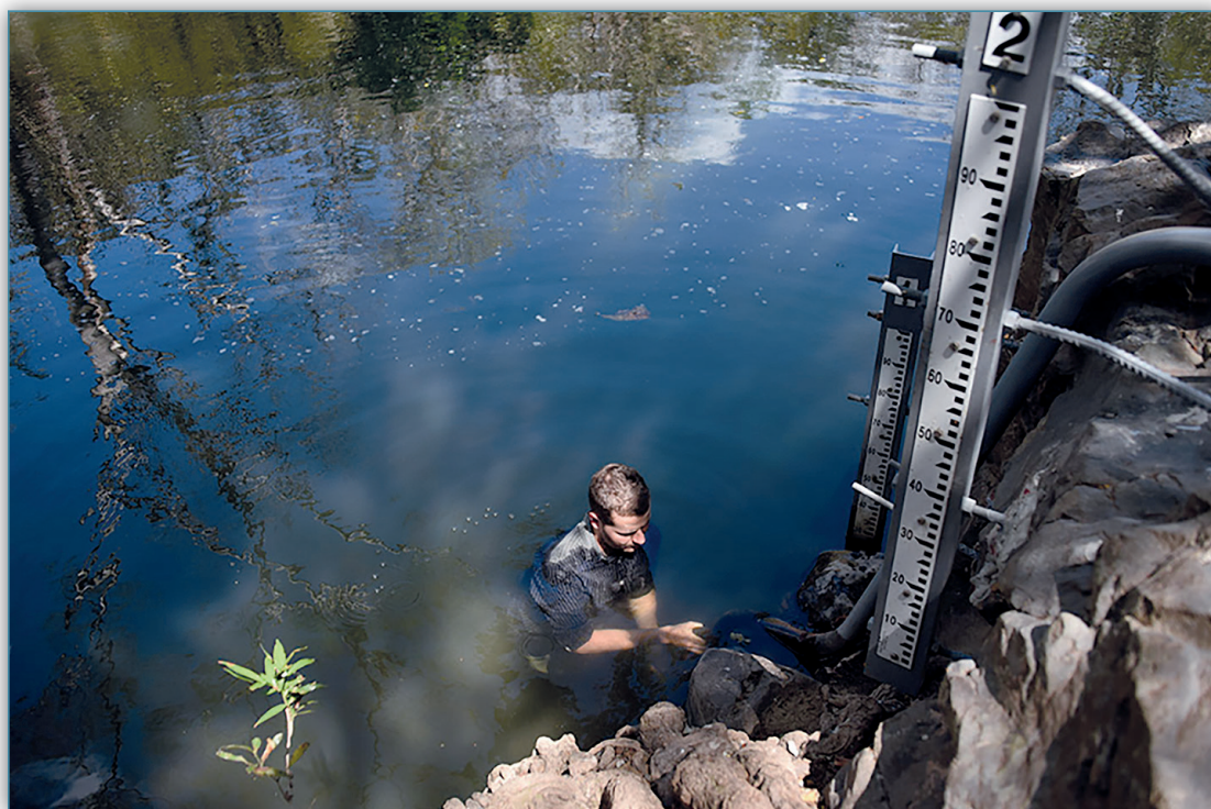
Figura 12. Todos los meses, un equipo de profesionales de la UCR realiza mediciones y el análisis del agua en el río Abangares y sus afluentes. Para ello, se apoyan con estaciones de medición de caudal y de medición de lluvias, así como con estaciones meteorológicas instaladas a lo largo de la cuenca