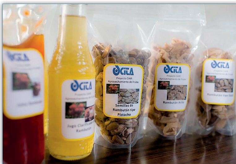
Figura 14. Proyecto de aprovechamiento de frutas